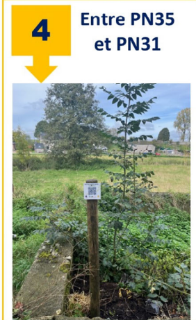
4 Entre PN35 et PN31