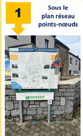
1 Sous le plan réseau points-nœuds

Rien de plus simple ... Munissez-vous de votre GSM et scannez les 5 QR codes installés le long du parcours. Derrière chaque QR code, un épisode du conte vous sera dévoilé ... La localisation des QR code se trouve sur le plan. Le premier se trouve sous le plan du réseau de points-nœuds pédestres à droite de la Maison de village (PN 40).